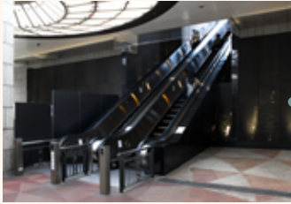
クリスタ長堀南 10 番出口