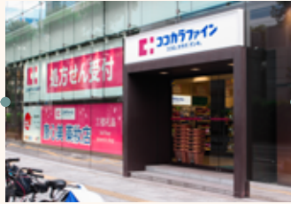
ココカラファインさんの 前の道を進みます