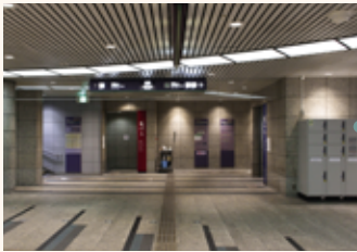
クリスタ長堀南 8 番出口