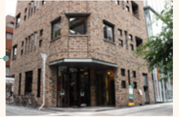
煉瓦づくりのビル 5 階まで エレベーターでお越し下さい