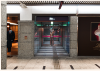
クリスタ長堀南 9 番出口