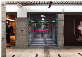
クリスタ長堀南 9 番出口