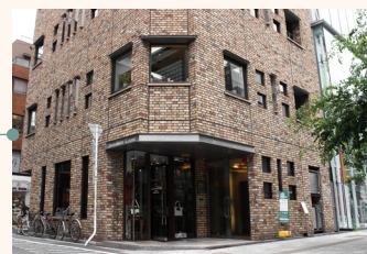
煉瓦づくりのビル 5 階まで エレベーターでお越し下さい