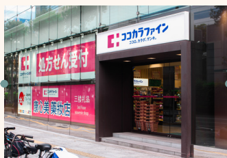
ココカラファインさんの 前の道を進みます