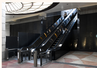
クリスタ長堀南 10 番出口